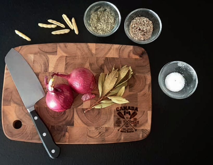
Akazien-Schneidebrett MOSAIK, Beispiel Einbrand