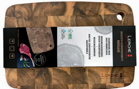
Beispiel Einbrand und individuelle Banderole (Preis auf Anfrage)

Lieferzeit: ca. 3-4 Wochen nach Produktionsfreigabe | Fixtermin? Fragen Sie nach unserem Express-Service! Angebot freibleibend, Preise zzgl. MwSt. ab Werk, Irrtümer vorbehalten. Bitte senden Sie uns Ihre druckfähigen PDF- oder EPS-Daten inklusive Pantone Farbangaben zu.